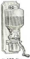
Nr. 109 Glas